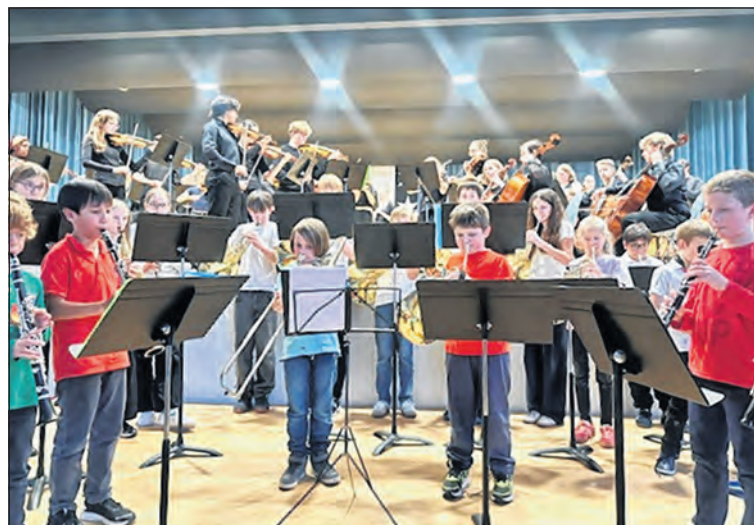
Das Gemeinschaftskonzert «Vom Start bis ins Orchester».

Am Samstag, 9. Mai 2026, folgte mit der Tanzaufführung