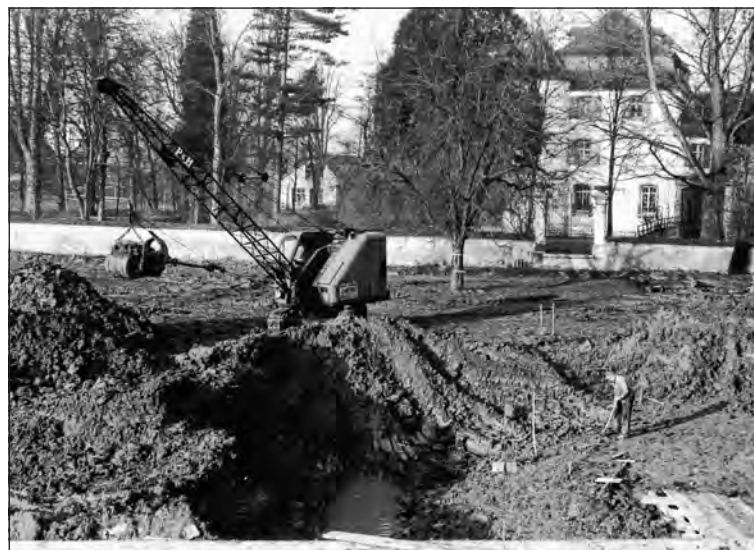
Aushubarbeiten für das Schwimmbecken.

2020 konnte die Gartensaison aufgrund der Corona-Pandemie erst 24 Tage später gestartet werden als geplant – die Besucherzahlen brachen in den beiden ersten Pandemie Jahren deutlich ein auf noch knapp 80 000. 2025 haben sie sich wieder auf dem Niveau vor der Pandemie eingependelt bei rund 98 000 Eintritten.