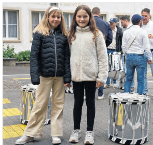
Warm angezogen, versammelten sich junge und alte Banntäger vor der Gemeindeverwaltung.