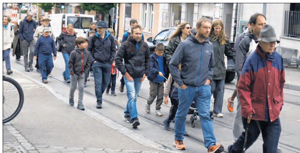
Am Nachmittag zog die zweite Rotte über die Haupt- und Benkenstrasse zum Paradieshof, wo der gesellige Teil des Banntags wartete.