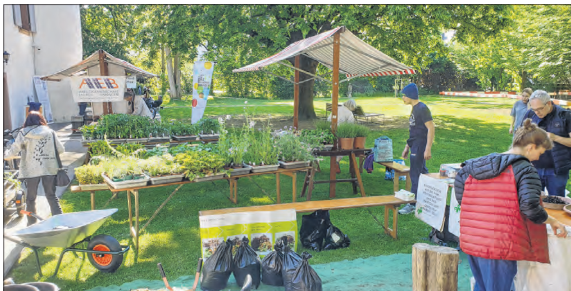
Es gab zahlreiche Setzlinge für den heimischen Garten. Bei der Auswahl half die Beratung.