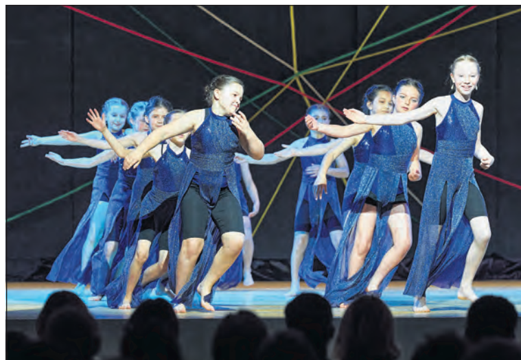
Szene aus der Tanzaufführung «Geschichten».

Im Jubiläumsjahr zeigt die Musikschule Binningen-Bottmingen mit zwei weiteren Glanzpunkten ihre künstlerische Vielfalt. Ein Ensemble-Abend und eine grosse Tanzaufführung verwandelten den Kronenmattsaal Anfang Mai in einen Ort musikalischer und tänzerischer Begegnung.