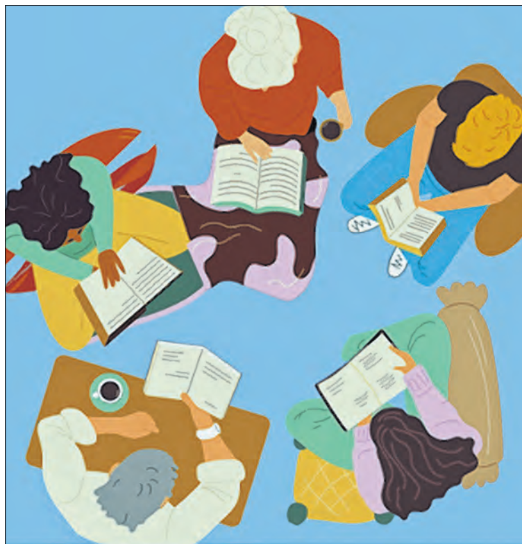
Jung und Alt lesen vier Bücher zum Thema «Generationen».

Vergangene Ausgaben haben uns gezeigt, dass der Austausch