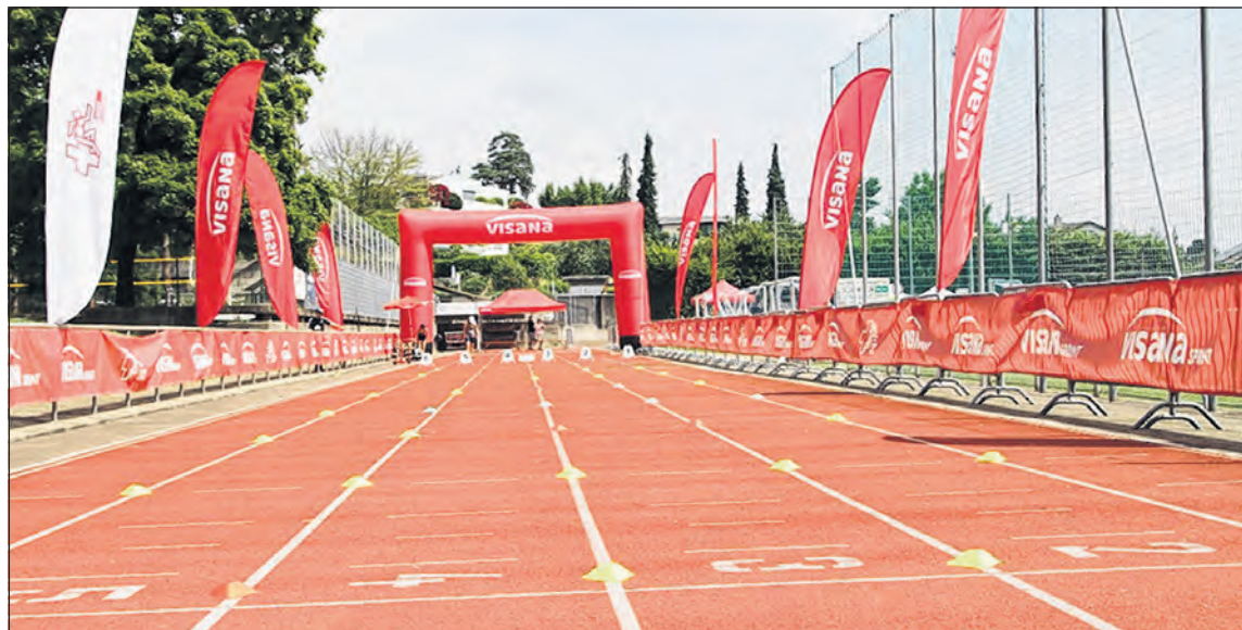
Bild aus dem Vorjahr: Auch heuer wird der Kantonsfinal des Visana Sprints im Spiegelfeld ausgetragen.

Beim Visana Sprint, dem ältesten Nachwuchsprojekt von Swiss Athletics, dreht sich alles um kleine Sprints und grosse Emotionen. Ob in der Stadt oder im Dorf: Sprinten kann jedes Kind – und jedes Kind will das schnellste sein. Als Projektpartner und Namensgeber fördert Visana freilich nicht nur die Schnellsten des Landes, sondern schafft zusammen mit Botschafterin Mujinga Kambundji unvergessliche Erlebnisse für die ganze Fami-