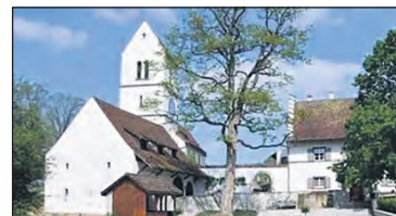
Den Beginn der Wanderung prägt die geschichtsträchtige St. Nikolaus Kirche in Oltingen.

Anmeldung ist notwendig bis 25. Mai abends an pesystalder@bluewin.ch oder unter 077 408 83 06 (Whatsapp möglich). Nächste Wanderung über 2,5 Stunden: Donnerstag, 4. Juni. Nächste Kurzwanderung über 1,5 Stunden: Mittwoch, 24. Juni.