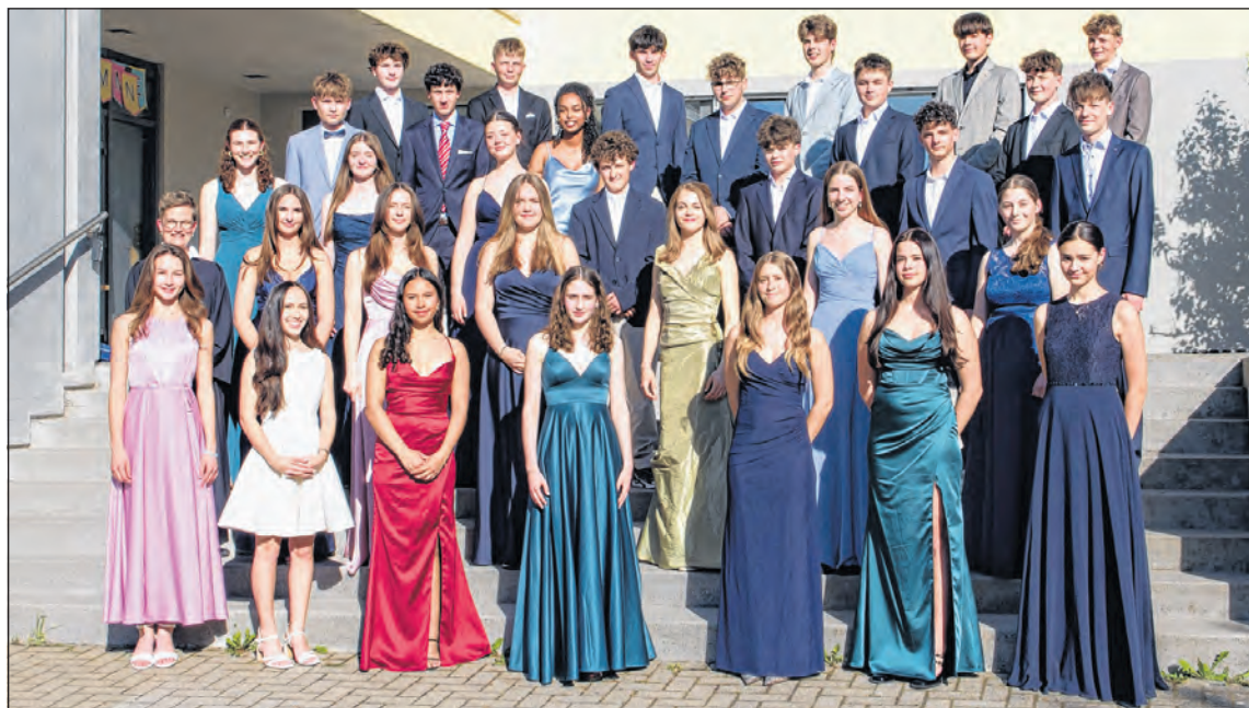
32 junge Menschen haben in der reformierten Kirchgemeinde ihre Konfirmation gefeiert. Text Natascha Hügin