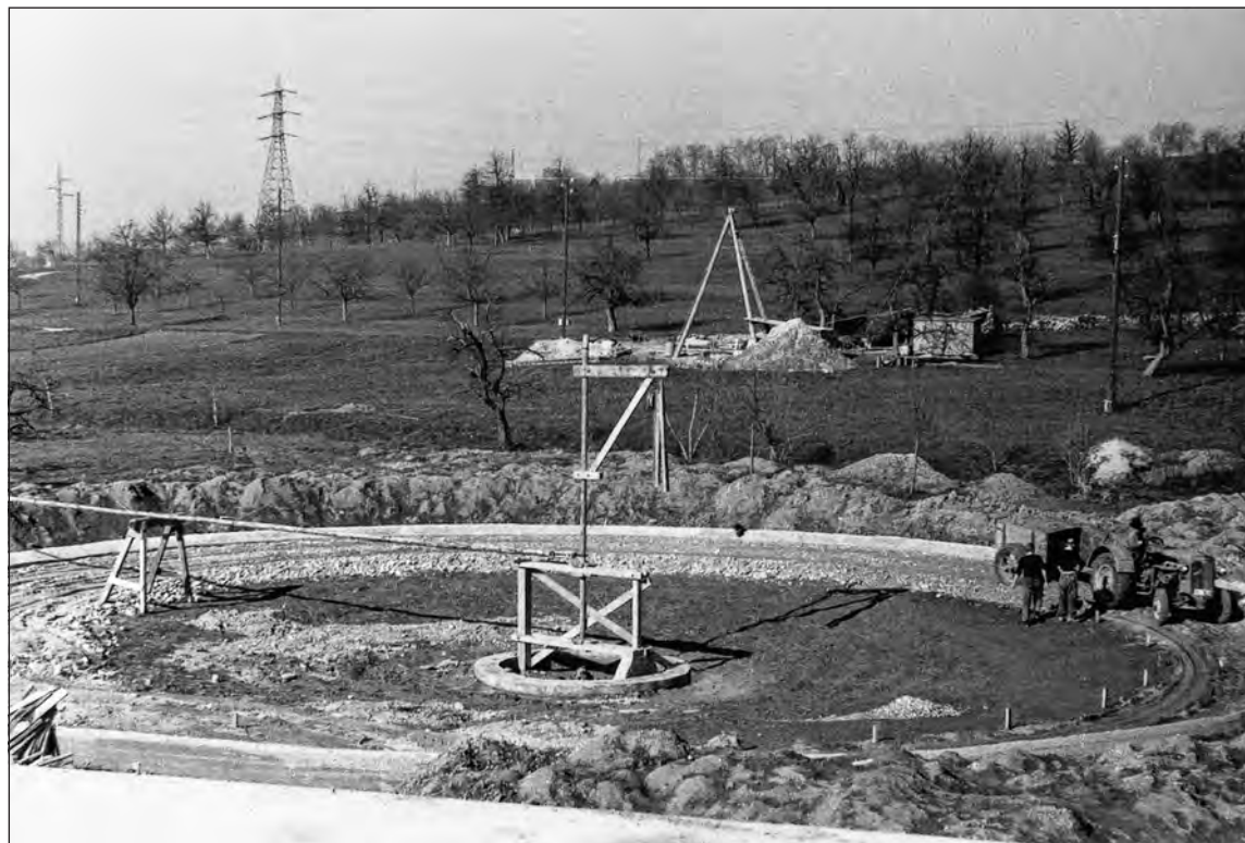
Erstellung des Rundbeckens.

Anfang 1954 erhielt eine Studienkommission den Auftrag, ein Projekt mit Kostenvoranschlag