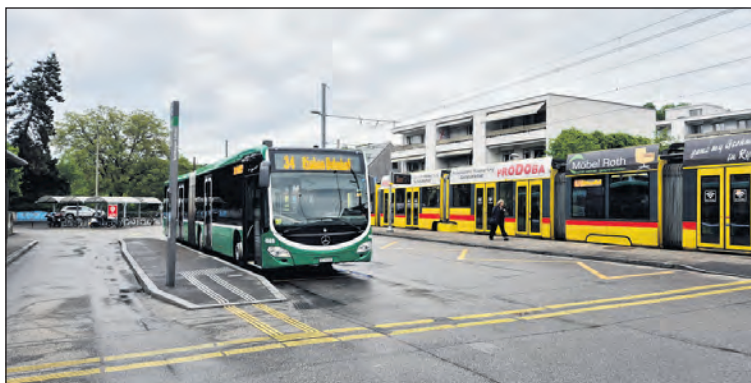
Die ÖV-Drehscheibe Bottmingen soll modernisiert werden.