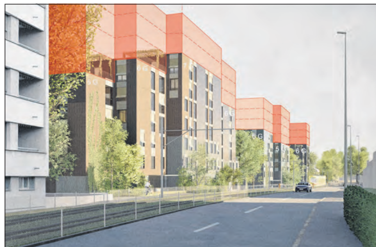
Diese Visualisierung des Pro-Komitees möchte die angebliche Gebäudehöhe in den Bildern der Gegenseite (in Rot) aufzeigen.

Amacker betonte, dass es sich beim Spiesshöfli nicht um einen neuen Stadtteil handle wie beim Klybeck-Areal in Basel. Auch wirke die Überbauung aus Sicht des Komitees als Lärmschutzriegel zur Bottmingerstrasse. Auf die Frage nach einem Plan B bei Ablehnung des Quartierplans antwortete Amacker: «Dann wird nichts passieren.» Laut Komitee müsste das laufende Verfahren abgebrochen und eine neue Quartierplanung gestartet werden. Diese Verfahren dauern laut Gemeindepräsidentin Caroline Rietschi bis zu zwei Jahre. Das Areal bliebe damit länger ungenutzt: «Die Brache bleibt», sagte Amacker.